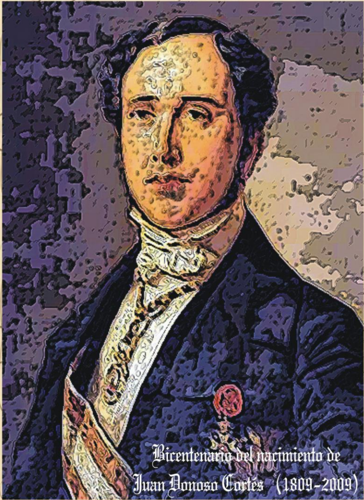
Bicentenario del nacimiento de Juan Donoso Cortés (1809-2009)